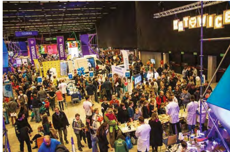
4. Śląski Festiwal Nauki KATOWICE

Idealnym miejscem do zorganizowania tego typu wydarzenia są centra kongresowe – z jednej strony przestronne, z drugiej to wciąż przestrzeń zamknięta. W dobie pandemii koronawirusa przekonaliśmy się, że drugi aspekt jest również źródłem zagrożenia. W takiej sytuacji z pomocą przychodzi platformy online. Internet jest przestrzenią, w której dzieje się już tak wiele, że zorganizowanie festiwalu naukowego nie wydaje się właściwie niczym trudnym. Tym bardziej, że dostęp do wiedzy nigdy nie był łatwiejszy. Internet sięga dalej, niż możemy sobie wyobrazić. Codziennie korzystają z niego miliardy ludzi, co znacznie zwiększa liczbę odbiorców. Ale czy na dłuższą metę, w przestrzeni wirtualnej, wspomniany wcześniej wachlarz odbiorców może być utrzymany? Czy właśnie tam, gdzie jest już wszystko, oferta takiego festiwalu będzie równie przyciągająca, co w świecie rzeczywistym?