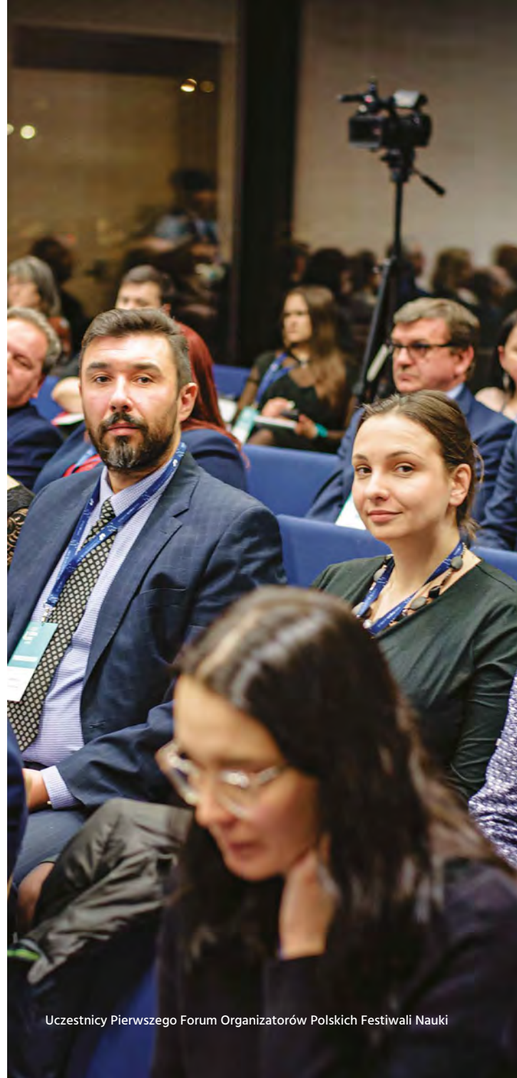
Uczestnicy Pierwszego Forum Organizatorów Polskich Festiwali Nauki

Jako organizatorzy festiwali nauki powinniśmy postrzegać obecny kryzys jako możliwość wspólnego rozwijania nowych pomysłów i uczenia się w ramach naszych sieci krajowych i międzynarodowych. Taką siecią jest European Science Engagement Association – z radością witamy wszystkie koleżanki i kolegów, którzy są zainteresowani udostępnianiem, uczeniem się i opracowywaniem nowych ścieżek dla nowatorskiej promocji nauki i wirujących festiwali nauki!