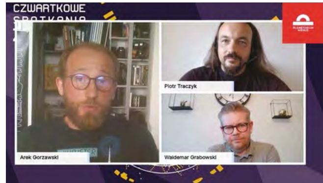
Webinar „Spotkania z Fizyką”. Archiwum własne

zdrowotne, czasowe, czy jakiegokolwiek inne, każdy może uczestniczyć na takich warunkach, jakie jemu odpowiadają. Jest to oczywiście korzyść płynąca z takiego rozwiązania. Z drugiej jednak strony nie ma pewności, że te same osoby, które przyszłyby na festiwal nauki i wysłuchały konkretnej prezentacji, zdecydowałyby się na jej wirtualny odpowiednik. Internet nie zastąpi wszystkiego. Mamy tu do czynienia z podobną sytuacją, jak w przypadku koncertu ulubionego zespołu. Nawet najlepiej zrealizowane nagranie z perfekcyjną jakością dźwięku nie oddaje tego, co czuje się na stadionie podczas wystąpienia na żywo. Kiedy wszystkie zmysły są zaangażowane, przez ciało przechodzą dreszcze, możemy poczuć wspólnotę z setkami albo i tysiącami ludzi wokół. Odkrywamy każdy utwór na nowo, pomimo że znamy je na pamięć, śpiewając wraz z wykonawcą i wszystkimi fanami. Tego nie da się poczuć, kiedy słucha się płyty z nawet najlepiej nagrany utworem. Siłą spotkań bezpośrednich jest ich energia, czymś, czego nie można (wcale czy nawet w podobnym wymiarze) przesłać sekwencją bitów i impulsów elektrycznych. Czymś, co sprawia, że gdy widzimy prelegenta, momentalnie się zatrzymujemy albo przyspieszamy kroku, bo to zawsze działa w obie strony. Tego nie można uzyskać w internecie. Przynajmniej nie w formie prostego webinaru.